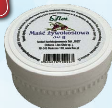
Maść żywokostowa 30 g F06020100514