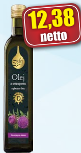
Olej z ostropestu tłoczony na zimno z witaminą D3 0,25 l S08030000152