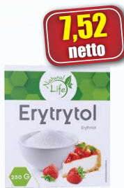
Erytrytol 250 g Natural life S04060000065