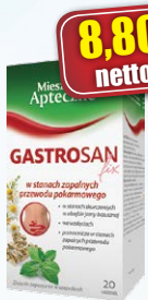
8,80 netto Gastrosan fix 2g*20 F05010000014