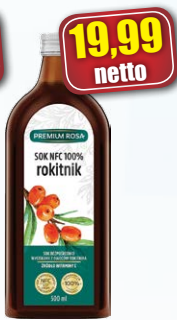
Sok rokitnik 100% 0,5 l S08020000049