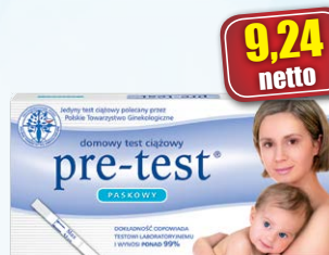
Test ciążyowy paskowy PRE-TEST F06050000035