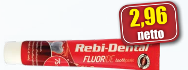
Pasta do zębów Rebi-dental fluoride 75 g F06030100197