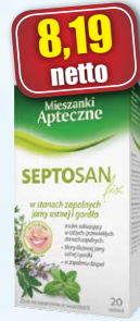
8,19 netto Septosan fix 2g*20 F05010000039