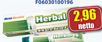
Pasta do zębów Rebi-dental herbal 100 g F06030100198