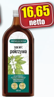
Sok z pokrzywy 100% 0,5 l S08020000034