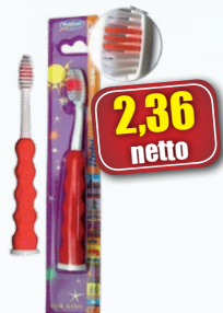
Szczoteczka do zębów dla dzieci M14 Miękka F06030300118