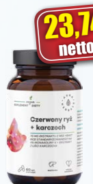
23,74 netto Czerwony Ryż + Karczoch 60 kaps. S10010000156