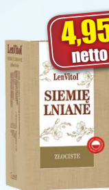
Siemien lniane złociste 250 g S02040000156