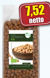
Ciecierzycza BIO 400 g S04070000034