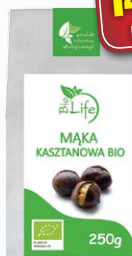
Mąka kasztanowa BIO 250 g S04010000084