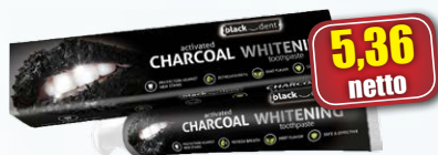
Pasta do zębów Black-Dent 75 g F06030100180