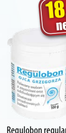
18,75 netto Regulobon regularne wpróżnienie, wspomaga odchudzenie 100 g F02040000063