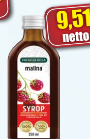
Syrup malinowy 0,25 l S08010000041