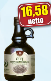
Olej słonecznikowy 0,5 l S08030000045