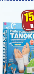
15,96 netto Tanoki plastry oczyszczające 10 szt. S11000000036