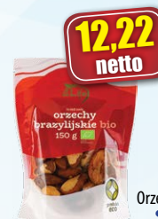
Orzech brazylijskie BIO 150 g S0405000085