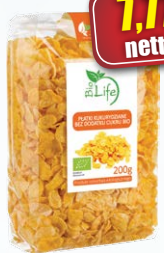
Płatki kukurydziane BIO 200 g S03010000086