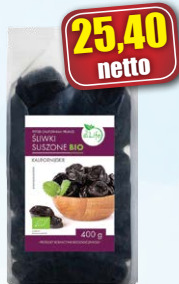
Śliwka suszona kalifornijska BIO 400 g S0405000082