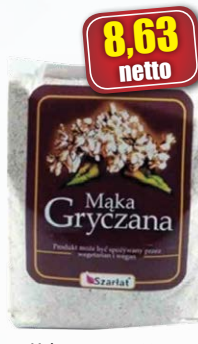
Maka gryczana 500 g S04010000039