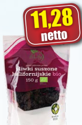
Śliwka suszona kalifornijska BIO 150 g S0405000081