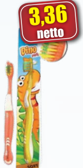
Szczoteczka do zębów M 48 DINO miękka F06030300001