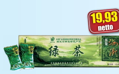
Herbata Ninghong fix 30*3 g S02030000119