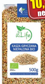
Kasza gryczana niepalona BIO 500 g S04030000075