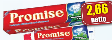
Pasta do zębów Promise z fluorem 100 g F06030100196