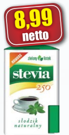
Słodzik Stevia 250 tab. F0204000089