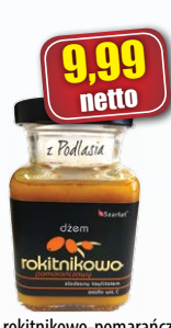
Dzemu rokitnikowo-pomarańczowy słodzony ksylitolem 150 g S03040000059