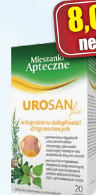
8,09 netto Urosan fix 2g*20 F05010000037