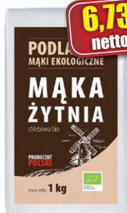
Mąka żytnia chlebową BIO 1 kg S04010000074