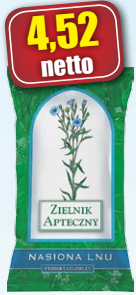
4,52 netto Len nasiona 250 g F05020000126