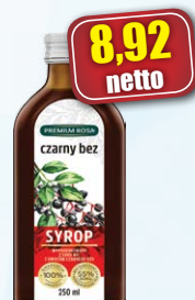
Syrup z czarnego bzu 0,25 l S08010000054