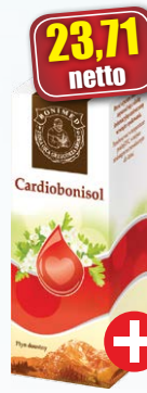
23,71 netto Cardiobonisol krople 100 g F01020000054