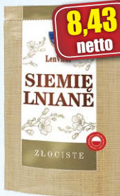
Siemien lniane złociste 450 g S02040000265