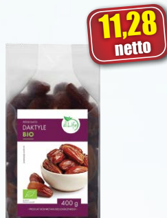
Daktyle BIO 400 g S04050000083