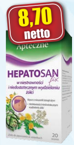
8,70 netto Hepatosan fix 2g*20 F05010000175