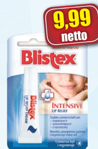
Balsam do ust Blistex intensive 6 ml F06050000037