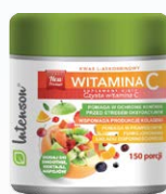
11,49 netto Witamina C 150 g S1005000061