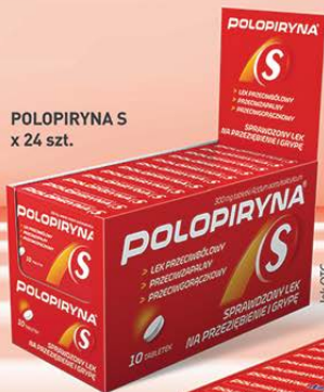
POLOPIRYNA S x 24 szt.