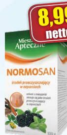
8,99 netto Normosan 100 g F05020000038