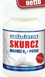
Skurcz Magnez B6+Potas 100 tabl. F02020000526