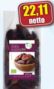
Morele BIO 400 g S0405000084