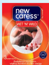
Unimil New Caress WET 'N' WILD 3 szt. F04010000049