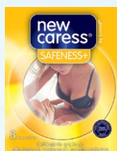
Unimil New Caress SAFENESS 3 szt. F04010000047