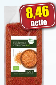
Soczewica czerowna BIO 400 g S04070000033