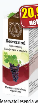
20,95 netto Resveratrol esencja wina w kroplach 200 ml S10030000083