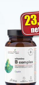
23,74 netto Witamina B complex 90 kaps. S10010000161