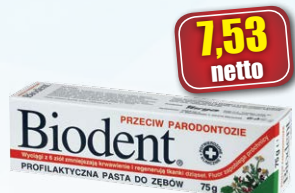
Pasta Biodent przeciw paradontozie 75 g F06030100092