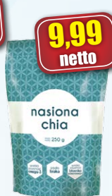
Nasiona chia 250 g S02040000264