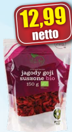
Jagody goji BIO 150 g S0405000088