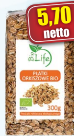
Płatki orkiszowe BIO 300 g S03010000087