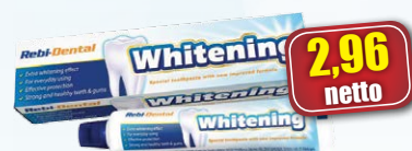
Pasta do zębów Rebi-dental whitening 100 g F06030100199