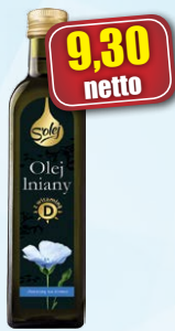
Olej lniany tłoczony na zimno z witaminą D3 0,25 l S08030000112