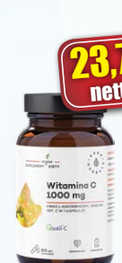
23,74 netto Witamina C Complex 60 kaps. S10010000162