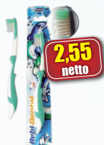
Szczoteczka do zębów M 16 miękka F06030300032