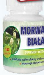
Morwa Biała 180 tabl. 120 mg F02020000508