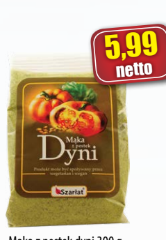
Maka z pestek dyni 300 g S04010000064