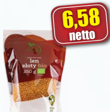
Siemien lniany złoty BIO 250 g S04080000060