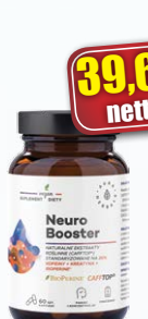
39,60 netto Neuro Booster 60 kaps. S10010000159