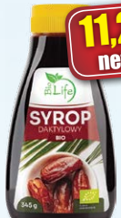
Syrup daktylowy BIO 345 g (250 ml) S08010000134