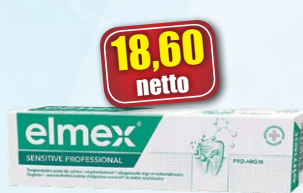
Elmex pasta sensitive professional 75 ml F06030100152