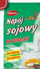
Napój sojowy naturalny bez laktozy, bez glutenu 400 g S08050000395