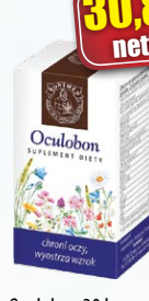
30,88 netto Oculobon 30 kaps. chroni oczy, wyostrza wzrok F02020000118