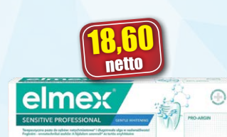
Elmex pasta sensitive whitening professional 75 ml F06030100153