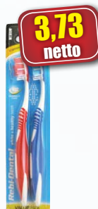
Szczoteczka do zębów duopack M-56 miękka F06030300109 Szczoteczka do zębów duopack M-56 średnia F06030300110