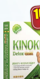
10,99 netto Kinoki plastry oczyszczające Detox Gold 10 szt. S11000000508