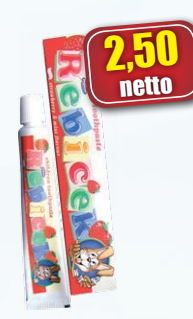
Pasta dla dzieci Rebickek 45 g F06030100202