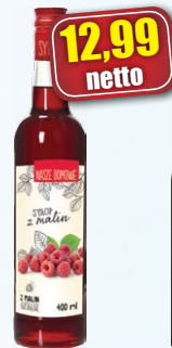
Syrup z malin 0,4 l S08010000011