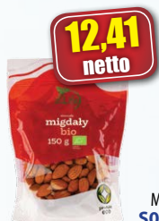
Migdały BIO 150 g S0405000086