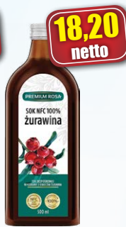
Sok zurawina 100% 0,5 l S08020000057