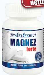
Magnez B6 Forte 100 tabl. 125 mg F02020000436