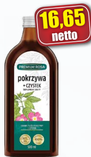
Sok pokrzywa+czystek 0,5 l S08020000276