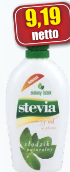
Stevia płyn 75 ml F0204000091