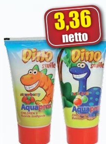
Pasty do zębów dla dzieci DINO: truskawka i tutti-frutti 60 g F06030100204 F06030100203