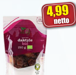
Daktyle BIO 150 g S04050000065