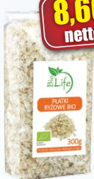
Płatki ryżowe BIO 300 g S03010000090