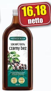
Sok czarny bez 100% 0,5 l S08020000040