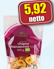
Chipsy bananowe BIO 150 g S01060000260