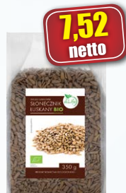
Pestki słonecznika BIO 350 g S04080000059