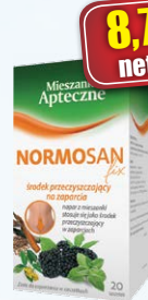
8,74 netto Normosan fix 1,4g*20 F05010000034