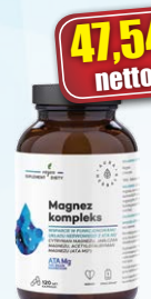
47,54 netto Magnez Kompleks 120 kaps. S10010000158