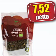
Pestki dyni BIO 150 g S04080000062