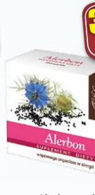
38,60 netto Alerbon 60 kaps. wspomaga organizm w alergii F02020000410