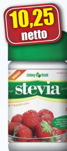
Słodzik Stevia 150 g puder F0204000090