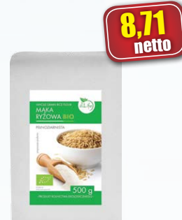
Mąka ryżowa pełnoziarnista BIO 500 g S04010000092