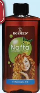
Nafta kosmetyczna z wit. A+E 150 ml F06010200027