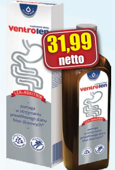
Ventrolen 0,5 l S08090000047