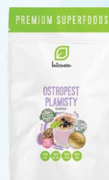
13,79 netto Ostropest plamisty ziarno 500 g S0204000344