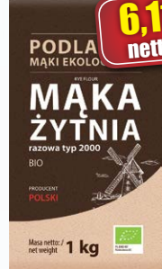
Mąka żytnia razowa BIO 1 kg S04010000088