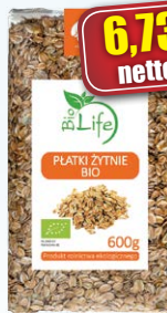
Płatki żytnie BIO 600 g S03010000102