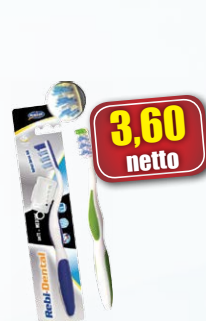
Szczoteczka do zębów M-47 miękka-średnia F06030300119