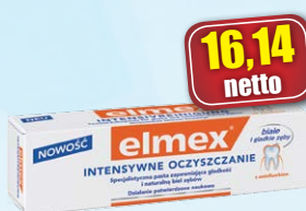
Elmex intensywne oczyszczanie 75 ml F06030100121