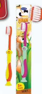
Szczoteczka do zębów M 66 d/dzieci 3+ lat miękka F06030300116