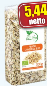
Płatki owsiane BIO 300 g S03010000088