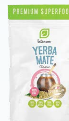
8,75 netto Yerba mate klasyczna 150 g S0204000314