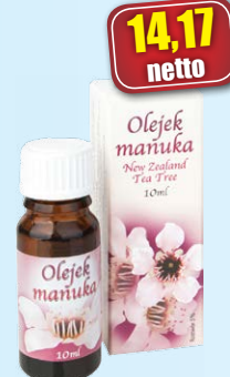
Olejek eteryczny z drzewka herbacianego 10 ml F06020900004