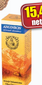
15,44 netto Ancinbon aerazol 9 ml S10030000024