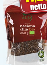
Nasiona chia BIO 250 g S02040000341