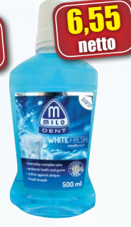
Płyn do płukania ust White Fresh 500 ml F06030200033