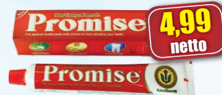
Pasta do zębów Promise 150 g F06030100209