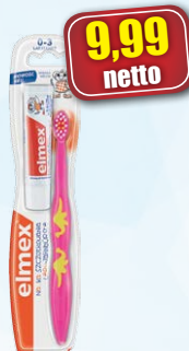
Elmex szczoteczka dla dzieci 0-3 lat soft nauka szczotkowania F06030300021