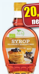
Syrup klonowy BIO 330 g (250 ml) S08010000136