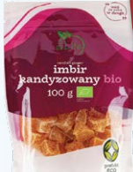
Imbir kandyzowany BIO 100 g S04050000076