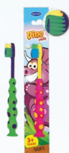
Szczoteczka do zębów M 65 d/dzieci 3+ lat miękka F06030300115