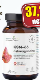
37,23 netto Ashwagandha korzeń 200 mg 120 kaps. S10010000155