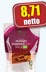
Mango suszone BIO 100 g S0405000089