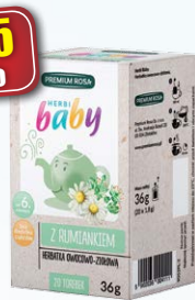
Herbata z rumiankiem fix*20 S02030000417