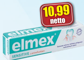
Elmex pasta sensitive plus 75 ml F06030100086