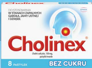
8 PASTYLEK BEZ CUKRU