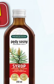
Syrup z pedow sosny 0,25 l S08010000088