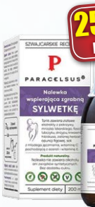
25,63 netto Nolewka wspierająca zgrabną sylwetkę 200 ml S08090000042