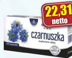
Czarnuszka 60 kaps. S10050000083