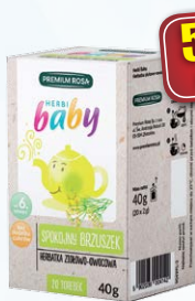
Spokojny Brzuszek fix*20 S02030000420