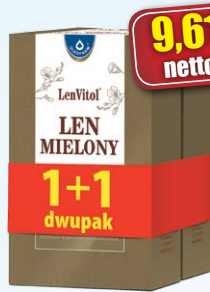
Len mielony 200 g+200 g S04050000014