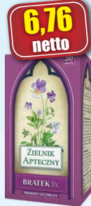
6,76 netto Bratek fix 2g*30 F05010000010