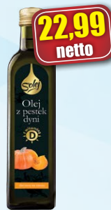
Olej z pestek dyni tłoczony na zimno z witaminą D3 0,25 l S08030000115