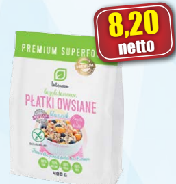
Płatki owsiane bezglutenowe 400 g S0301000049