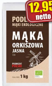
Mąka orkiszowa jasna BIO 1 kg S04010000073