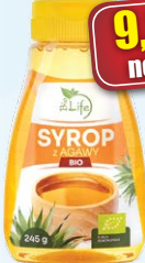
Syrup z agawy BIO 245 g (180 ml) S08010000135