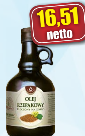
Olej rzepakowy 0,5 l S08030000022