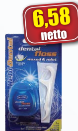
Niść dentystyczna Mattes 50 ml F06030400007