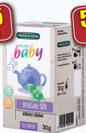
Spokojny Sen fix*20 S02030000421