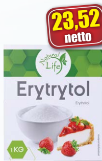
Erytrytol 1 kg (4*250 g) Natural life S04060000064