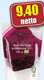
Żurawina suszona BIO 150 g S0405000090