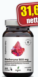
31,67 netto Berberyna 500 mg 60 kaps. S10010000100