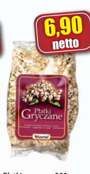
Platki gryczane 300 g S03010000021