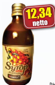
Syrup z rokitnika 300 ml S08010000092