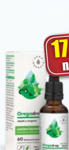
17,38 netto Oregadrop olej z oregano krople 30 ml S10030000146