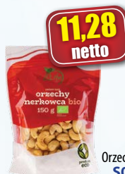
Orzech nerkowca BIO 150 g S0405000087