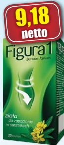
9,18 netto Figura 1 fix 3g*20 F05010000133