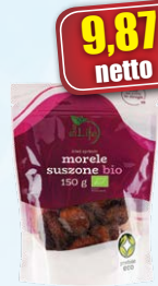
Morele BIO 150 g S0405000066