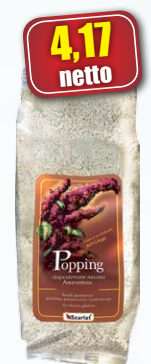
Amarantus popping 100 g S04080000013