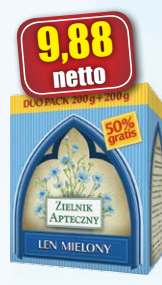
9,88 netto Len mielony 200 g + 200 g S04050000077