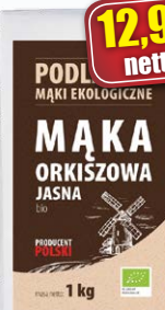
Mąka orkiszowa jasna BIO 1 kg S04010000073