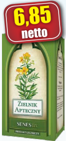
6,85 netto Senes fix 1 g*30 F05010000001