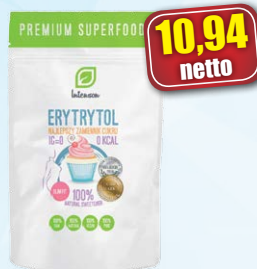
Erytrytol 1000 g S0406000062