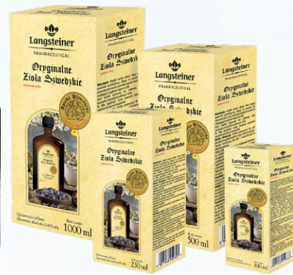
Originalne Zioła Szwedzkie 100 ml S08090000046