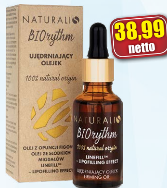
Biorhythm olejek ujędrniający do twarzy 30 ml F0602000018