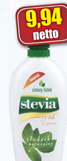
Stevia płyn 75 ml F0204000091