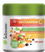
11,49 netto Witamina C 150 g S1005000061