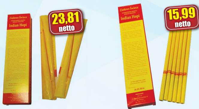
Świece konchy 6 szt. S11000000017