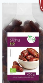
Daktyle BIO 400 g S04050000083