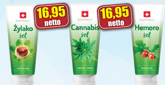
Żylako żel ciężkie nogi 200 ml F06020100471