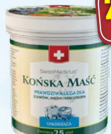
Maść końska chłodząca 250 ml F06020200018