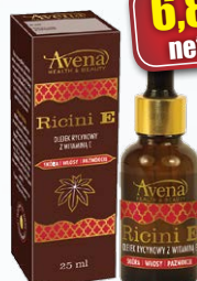
Ricini E olejek rycynowy z witaminą E 25 ml F06020000020