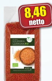
Soczewica czerowna BIO 400 g S04070000033