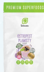
13,79 netto Ostropest plamisty ziarno 500 g S0204000344