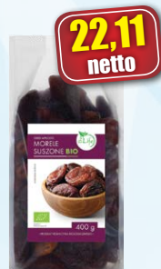
Morele BIO 400 g S0405000084