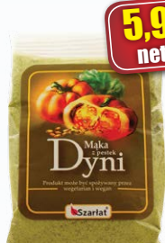
Mąka z pestek dyni 300 g S04010000064