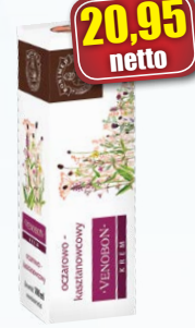
20,95 netto Venobon krem oczarowo-kasztanowcowy 100 ml F06020100474