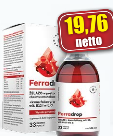
19,76 netto Ferradrop żelazo + kwas foliowy 500 ml S10050000243