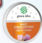
Maść żywokostowa 100% BIO 50 ml F06020100510