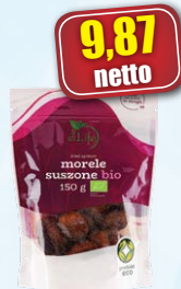
Morele BIO 150 g S0405000066