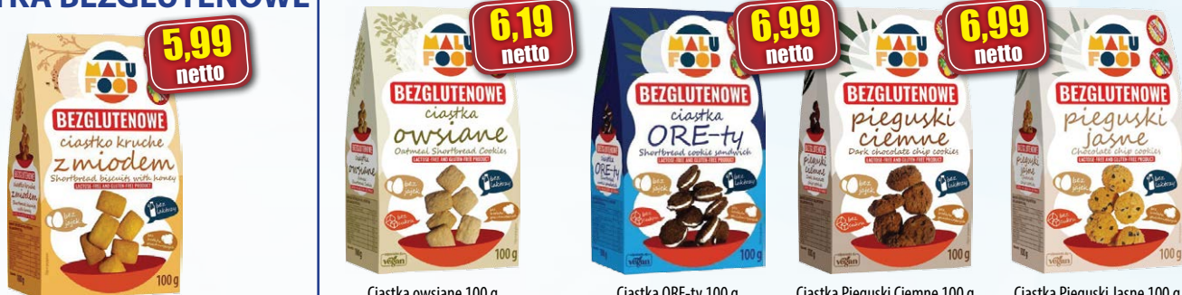
Ciastka kruche z miodem 100 g S01050000467