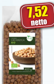
Ciecierzycza BIO 400 g S04070000034