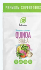
6,56 netto Quinoa komosa ryzowa (biała) 250 g S0408000039