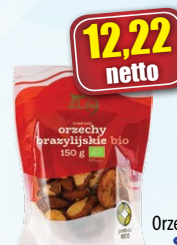
Orzech brazylijskie BIO 150 g S0405000085