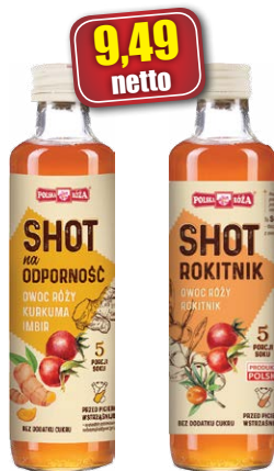
Shot na Odporność 250 ml S08010000132 Shot Rokitnik 250 ml S08010000148