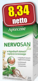
8,34 netto Nervosan fix 2 g*20 F05010000033