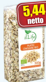
Płatki owsiane BIO 300 g S03010000088