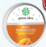
Maść propolisowa 100% BIO 50 ml F06020100511