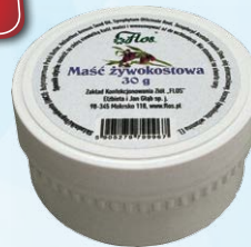
Maść żywokostowa 30 g F06020100514