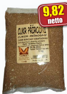
Cukier buraczany nierafinowany 1 kg S04060000006