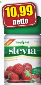
Słodzik Stevia 150g puder F0204000090