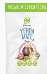
8,75 netto Yerba mate klasyczna 150 g S0204000314