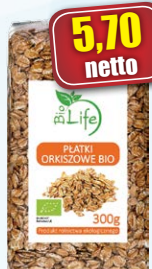
Płatki orkiszowe BIO 300 g S03010000087