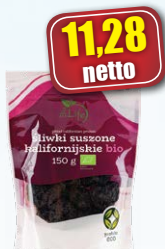
Śliwka suszona kalifornijska BIO 150 g S0405000081