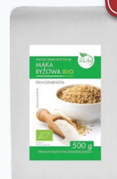
Mąka ryżowa pełnoziarnista BIO 500 g S04010000092