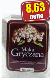
Mąka gryczana 500 g S04010000039