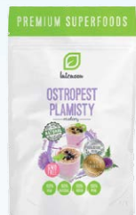
11,99 netto Ostropest plamisty mielony 500 g S0204000313