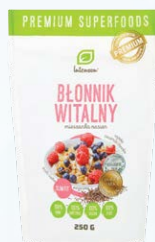
11,99 netto Błonnik witalny mieszanka nasion 250 g S1003000161