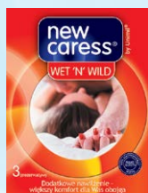
Unimil New Caress WET 'N' WILD 3 szt. F04010000049