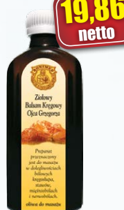
19,86 netto Balsam kręgowy Ojca Grzegorza 100 g S08090000004