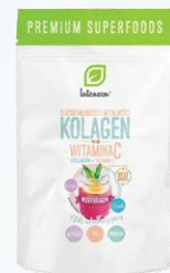
41,54 netto Kolagen + wit. C 250 g S1003000162