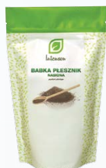
9,85 netto Babka pszenik ziarno 200 g S1003000073