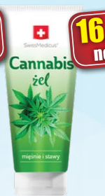
Cannabis żel mięśnie i stawy 200 ml F06020100460