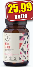
25,99 netto Moje Serce, wsparcie funkcji serca 60 kaps. S10010000172