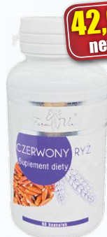
Czerwony Ryż 60 kaps. S10010000150