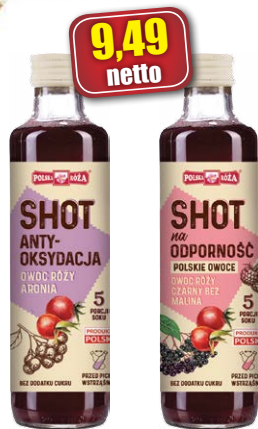
Shot Antyoksydacja 250 ml S08010000143 Shot na Odporność „Polskie Owoce” 250 ml S08010000142