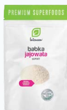
13,13 netto Babka jajowata lupiny 150 g S1003000072