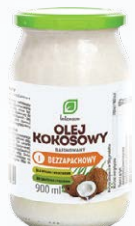
15,94 netto Olej kokosowy 900 ml rafinowany S0803000087