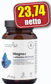
23,74 netto Magnez + witamina B6 60 kaps. S10010000168