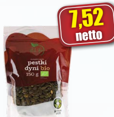
Pestki dyni BIO 150 g S04080000062