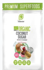
9,39 netto Cukier kokosowy 200 g BIO S0406000068