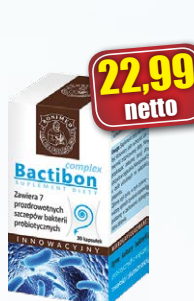
22,99 netto Bactibon complex 20 kaps. S10010000101