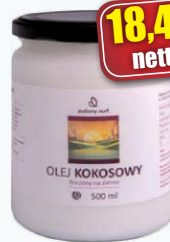
Olej kokosowy 100% tłoczony na zimno, nieoczyszczony 500 ml S08030000021