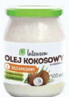
9,87 netto Olej kokosowy 500 ml rafinowany S0803000086