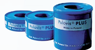
Plaster Polovis 5m *12,5mm F03010000005