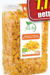
Płatki kukurydziane BIO 200 g S03010000086