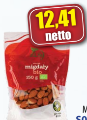
Migdały BIO 150 g S0405000086