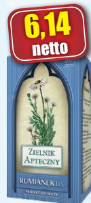
6,14 netto Rumianek fix 1,5 g*30 F05010000029