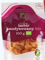
Imbir kandyzowany BIO 100 g S04050000076