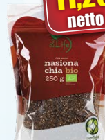
Nasiona chia BIO 250 g S02040000341