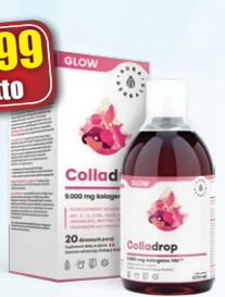
62,99 netto Colladrop Glow kolagen morski 5000 mg 500 ml S10050000242