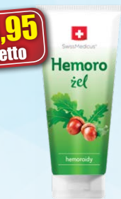
Hemoro żel hemoroidy 200 ml F06020100461