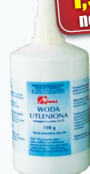
Woda utleniona 3% 100 g F01020000102