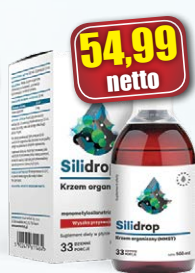
54,99 netto Silidrop krzem organiczny 500 ml S10050000206