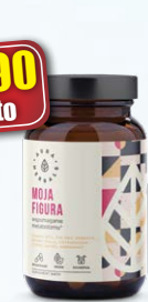
27,69 netto Moja Figura wspomaganie metabolizmu 60 kaps. S10010000170