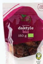
Daktyle BIO 150 g S04050000065