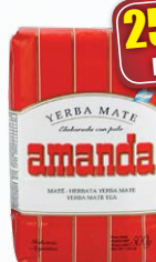
Yerba Mate Amanda smak pomarańczy 500 g S02040000183