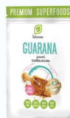
21,89 netto Guarana mielona 100 g S1003000192