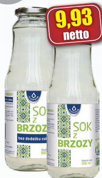
Sok z brzozy bez dodatku cukru 990 ml S08020000487 Sok z brzozy 990 ml S08020000485