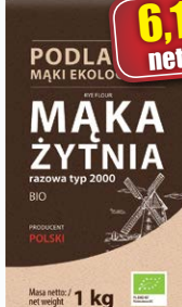
Mąka żytnia razowa BIO 1 kg S04010000088