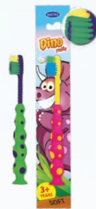
Szczoteczka do zębów dla dzieci M14 Miękka F06030300118