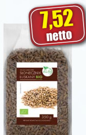
Pestki słonecznika BIO 350 g S04080000059