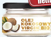
Olej kokosowy extra virgin BIO 200 g S08030000162