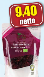
Żurawina suszona BIO 150 g S0405000090