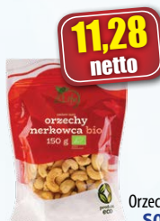
Orzech nerkowca BIO 150 g S0405000087