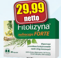
29,99 netto Fitolizyna Nefrocaps Forte 30 kaps. S10010000144