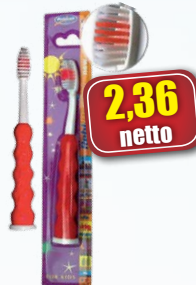
Szczoteczka do zębów M 16 miękka F06030300032