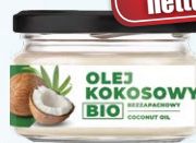
Olej kokosowy bezzapachowy BIO 200 g S08030000161