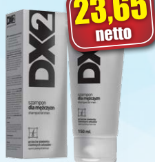
DX2 szampon 150 ml F06010100081