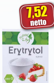
Erytrytol 250 g Natural life S04060000065