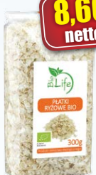
Płatki ryżowe BIO 300 g S03010000090