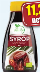
Syrup daktylowy BIO 345 g (250 ml) S08010000134