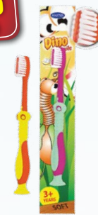
Szczoteczka do zębów M 66 d/dzieci 3+ lat miękka F06030300116