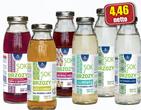
Sok z brzozy z granatem bez dodatku cukru 300 ml S08020000534 Sok z brzozy z jabłkiem bez dodatku cukru 300 ml S08020000535 Sok z brzozy z dziką różą bez dodatku cukru 300 ml S08020000178 Sok z brzozy z miętą bez dodatku cukru 300 ml S08020000179 Sok z brzozy 300 ml S08020000177 Sok z brzozy bez dodatku cukru 300 ml S08020000252