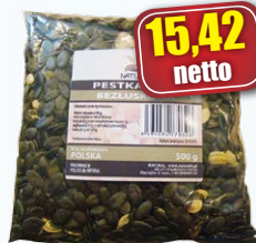
Dynia pestka bezłuskowa polska 500 g S04080000045