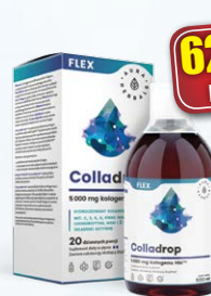
62,99 netto Colladrop Flex kolagen morski 5000 mg 500 ml S10050000241