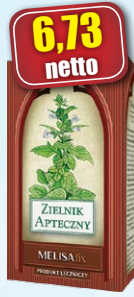
6,73 netto Melisa fix 2 g*30 F05010000020