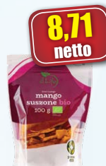
Mango suszone BIO 100 g S0405000089