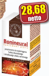
28,68 netto Bonineural 30 kaps. S10010000152