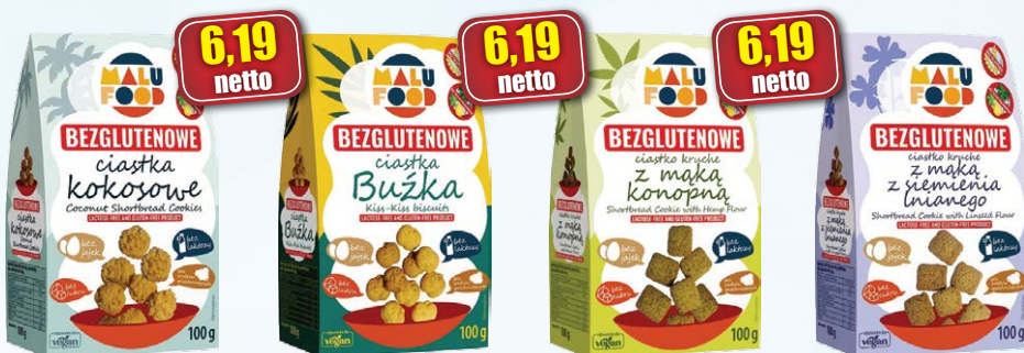
Ciastka kokosowe 100 g S01050000460