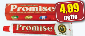
Pasta do zębów Promise z fluorem 100 g F06030100196