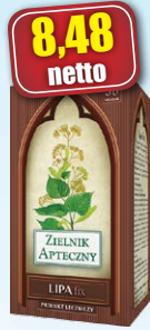
8,48 netto Lipa fix 1,5 g*30 F05010000019