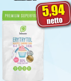
Erytrytol 500 g S0406000039