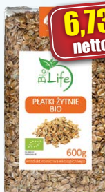
Płatki żytnie BIO 600 g S03010000102