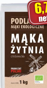
Mąka żytnia chlebowa BIO 1 kg S04010000074