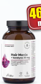
46,99 netto Hair Mania + keratyna 20 mg 120 kaps. S10050000245