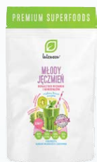
5,99 netto Młody jęczmień 100 g S1003000077