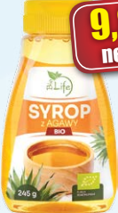
Syrup z agawy BIO 245 g (180 ml) S08010000135