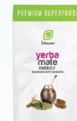
9,87 netto Yerba mate energia guarana i żeń szeń 150 g S0204000345