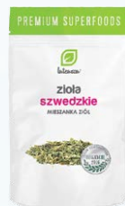
20,82 netto Ziela szwedzkie - susz 100 g S1003000078