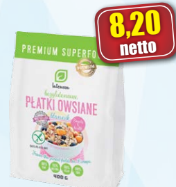
Płatki owsiane bezglutenowe 400 g S0301000049