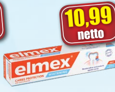
Elmex pasta przeciw próchnicy 75 ml F06030100076