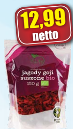
Jagody goji BIO 150 g S0405000088