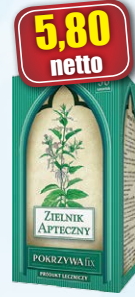
5,80 netto Pokrzywa fix 1,5 g*30 F05010000027