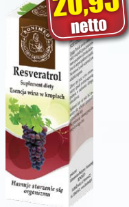
20,95 netto Resveratrol esencja wina w kroplach 20 ml S10030000083