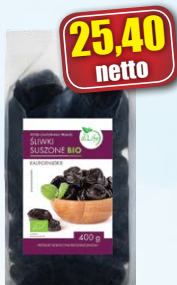
Śliwka suszona kalifornijska BIO 400 g S0405000082