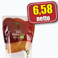
Siemien lniany złoty BIO 250 g S04080000060