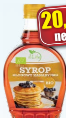
Syrup klonowy BIO 330 g (250 ml) S08010000136