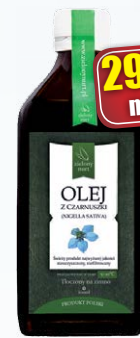
Olej z czarnuszki tłoczony na zimno, niefiltrowany, nieoczyszczony 250 ml S08030000116