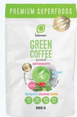
17,51 netto Kawa zielona mielona 250 g S0201000061