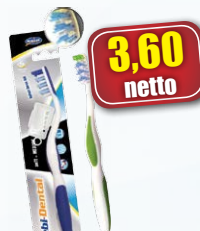
Szczoteczka do zębów quatropack M-458 średnia F06030300120