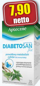
7,90 netto Diabetosan fix 2 g*20 S10030000136