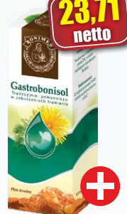
23,71 netto Gastrobonisol krople 100 g poprawia trawienie F01020000056