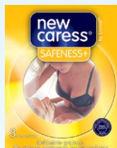
Unimil New Caress SAFENESS 3 szt. F04010000047