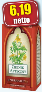
6,19 netto Dziurawiec fix 2 g*30 F05010000013