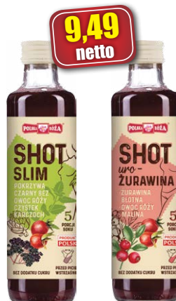
Shot Slim 250 ml S08010000150 Shot Żurawina 250 ml S08010000149