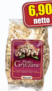
Płatki gryczane 300 g S03010000021