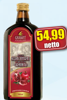
Grawit 100% koncentrat z granatu 500 ml S08020000071