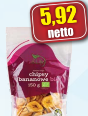
Chipsy bananowe BIO 150 g S01060000260