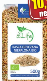
Kasza gryczana niepalona BIO 500 g S04030000075