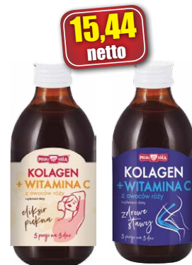
Eliksir Piękna Kolagen+Witamina C 250 ml S10050000198 Zdrowe Stawy Kolagen+Witamina C 250 ml S10050000203