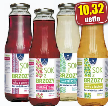
Sok z brzozy z granatem bez cukru 990 ml S08020000078