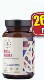
26,90 netto Moja Figura ograniczenie łaknienia 60 kaps. S10010000169