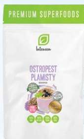
18,61 netto Ostropest plamisty mielony 1000 g S0204000227