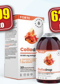
62,99 netto Colladrop Forte kolagen morski 10000 mg 500 ml S10050000205